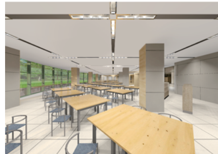
リニューアルイメージ

学生食堂がゼロカーボン・SDGsの理念の下に生まれ変わります。 県大の新たな交流拠点となり得る、学生や教職員にとって居心地が良く、地域の方も気軽に訪れるような場所を目指します。 学生会館1階の全体イメージはQRコードからご覧いただけます。