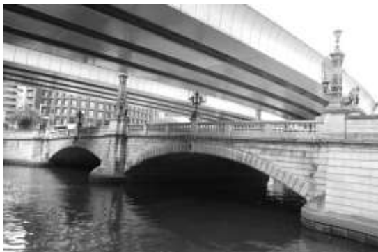
図 1. 日本橋、2022 年

問題 2 文章 1、文章 2、文章 3 は、東京都中央区にある日本橋とその上を走る首都高速道路の景観について述べたものである。これらの文章を読んで、下記の設問に答えなさい。なお、参考のために、時代ごとの日本橋の様子を図 1 から 3 に示している。