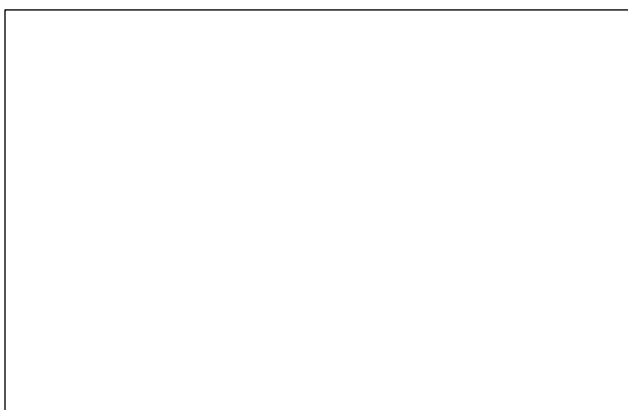
図 3. 日本橋、1830 年頃（歌川広重、江戸名所橋尽「日本橋」、東京都立図書館）